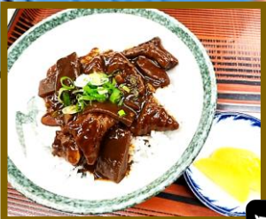
どて井 800円 どて煮 600円