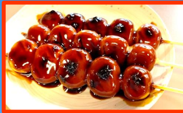
みたらし団子 1本100円 ※3本からのご注文